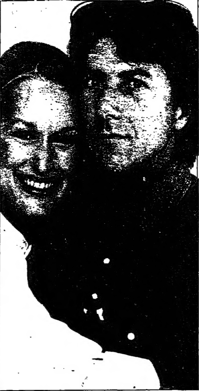
من الفيلم الجديد (كرايمر ضد كرايمر) : غزو عاطفي

هذا الاتجاه بدأ ظاهراً ، عبر التجاح الذي حققته الأفلام التي أنتجتها السنيما - وفي عدادها الأفلام المذكورة - فحسب السنة الماضية للظلم . وعندما نتحدث عن (العواطف) ، لا نقف عند الميودراما نخبس ، بل نتمدد حدودها الى العواطف الأخرى ، شرط أن تكون «بريئة» ، بمعنى من ألماني ! فلسفي قاموس هوليوود أن الجمهور ينجح الى دموع كثيرة ، وإلى ضحك كثير ، وإلى رعب كثير - أكثر من اللزوم - لأنه يفضل كل ما هو خارج من حياته اليومية ؛ والأفلام الفاجحة ، في هذا الموسم (نافسة - حاضرة) تؤكد هذا المهوم ! مثلاً ، فيلم (كرايمر ضد كرايمر) - القروس أن يكون أفلاماً اجتماعياً - هو فيلم (البريك) ، من أنه إلى ياله ، بعملية مضطمة لاسترداد الموعود ! لأن ، في السنيما ، اليوم ، تجبر كبير (للحواظ الخاصة) ، والمائلة ، والإبوية ! بل فيها فتح صفحة «المائلة» في كتاب التاريخ والافتكار . وقيل أن وراء ذلك : انعكاسات السنيما «المترمة» وأزمتها ! وفي انتظار كلمة علماء الاجتماع - مع ان العملية عملية جاحجة تبيض ذهاً - نشير الى أن العودة الإبداعية لتجسار الميودراما انسطحت على سلسلة واسعة من الأنواع . فعلى (زواج ماريا براون) ، المخرج الألماني فاسيندر ، اعتبر من نوع الميودراما ، رغم ان بريشت فيه - وما قاله فاسيندر ، خلفاً هذا الانعطاف : (علينا أن ننشئ عن الميودراما ، التي تمسحها البروليتاريا ، لا تلك التي